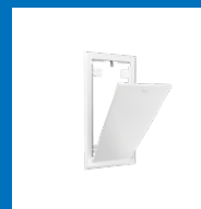
Ram och lucka